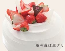
※写真は生クリーム仕様

12cm ¥3,400 15cm ¥4,200 18cm ¥5,400 21cm ¥7,200