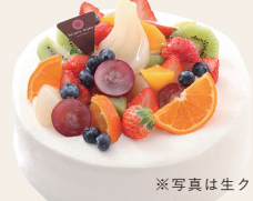
※写真は生クリーム仕様

12cm ¥3,600 15cm ¥4,500 18cm ¥5,800 21cm ¥7,700