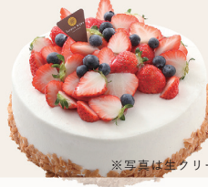
※写真は生クリーム仕様

12cm ¥3,900 15cm ¥4,800 18cm ¥6,400 21cm ¥8,700