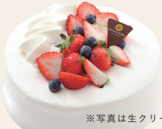
※写真は生クリーム仕様